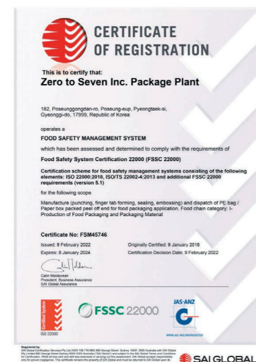
Certificado FSSC22000, IQTC